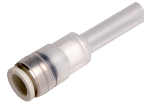
71.070 und 71.071: Steckröhrchen ( \varnothing d1 ) passt in Schlauchanschlüsse mit \varnothing 4 \text{ mm} / 6 \text{ mm}